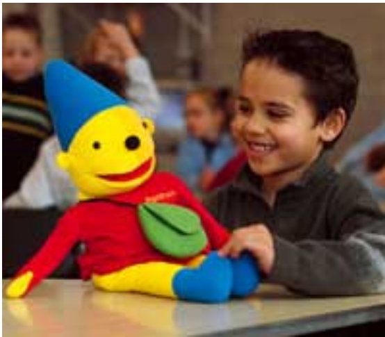
Pompom, het boegbeeld van Schatkist, speelt een belangrijke rol als vriendje van de kinderen

Moeten alle Nederlandse basisscholen aan de “BAK”?